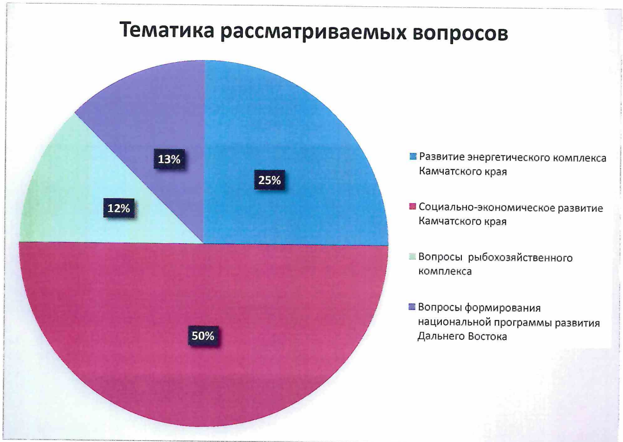
Диаграмма рассматриваемых вопросов:

Анализ содержания рассмотренных вопросов показывает, что актуальными для членов общественного Совета являлись вопросы социально-экономического развития Камчатского края. Значимыми вопросами для обсуждения и принятия решений в 2019 году были вопросы: формирования национальной программы развития Дальнего Востока, развития энергетического и рыбохозяйственного комплексов, мониторинга реализации национальных федеральных и региональных проектов в Камчатском крае, обеспеченности продуктами питания местного производства, организации ярмарок, деятельность МФЦ и др. Рассмотрение этих направлений будет продолжено и в 2020 году.